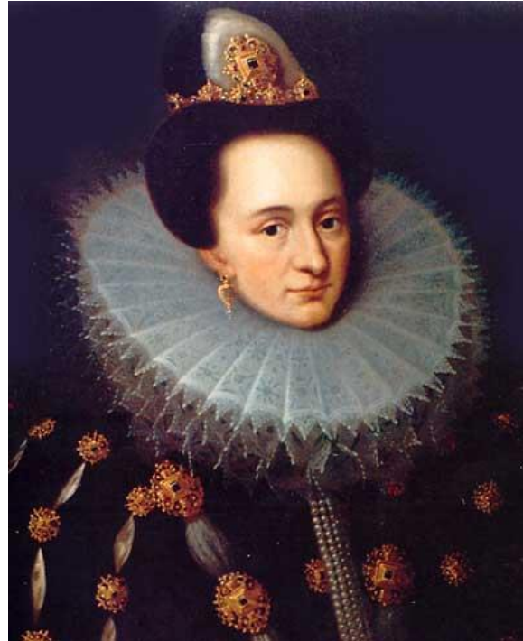
Maria van Maaike van Oranje-Nassau, de oudste dochter van Willem van Oranje, trouwt na bijna 30 jaar met Philips van Hohenlohe.