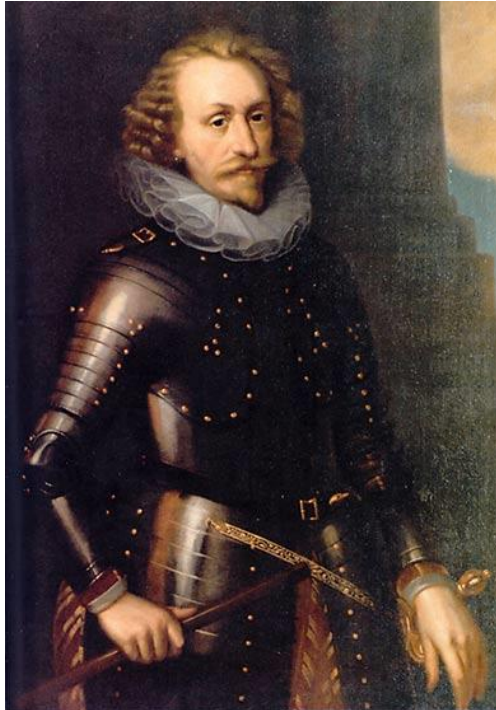
Philips, graaf van Hohenlohe (1550 - 1606) uit Würzburg.

Maarten Schenk gaat na deze overwinning zonder problemen naar Groningen. De stad blijft voorlopig in Spaanse handen.