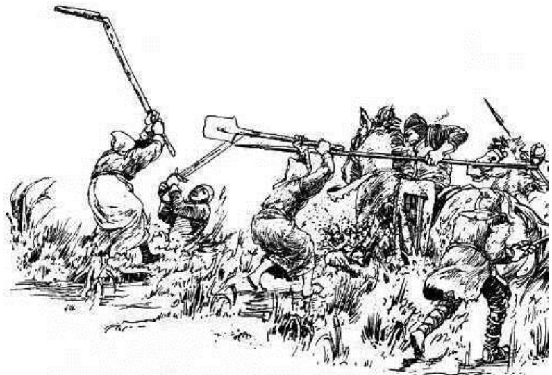
Illustraties: Fiel van der Veen, uit het boek Moord in het Moeras van Willem Wilmink

Maar... hebben ze niet gemerkt, dat ze door die „domme" Drenten het moeras worden ingelokt? De Mommenriete heeft geen vaste grond. De paarden met hun ruiters raken vast in de modder. Ze spartelen als „vliegen in de brij". Ze zinken ze steeds dieper in het moeras. Ook het paard van de bisschop. Snuivend en hinnikend van angst, trapt het in de