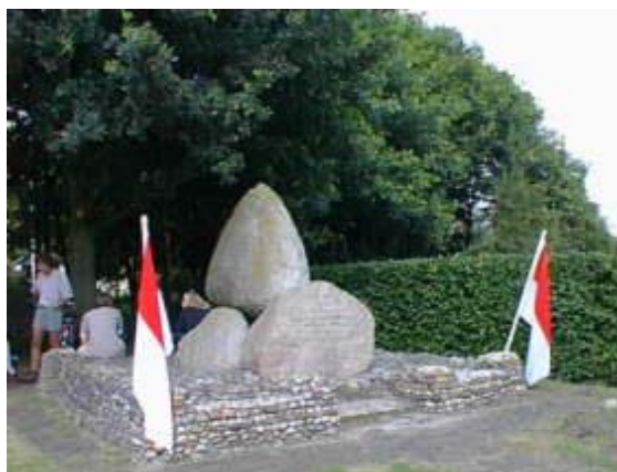
Ballade van de Slag bij Ane

Je zou de Slag bij Ane een „Gulden Sporenslag” kunnen noemen: In 1947 wordt in de Mommenriete een gulden spoor gevonden. Jaren na de slag durfden veel mensen, vooral in het donker, niet langs de Mommenriete, omdat het er spóókte!